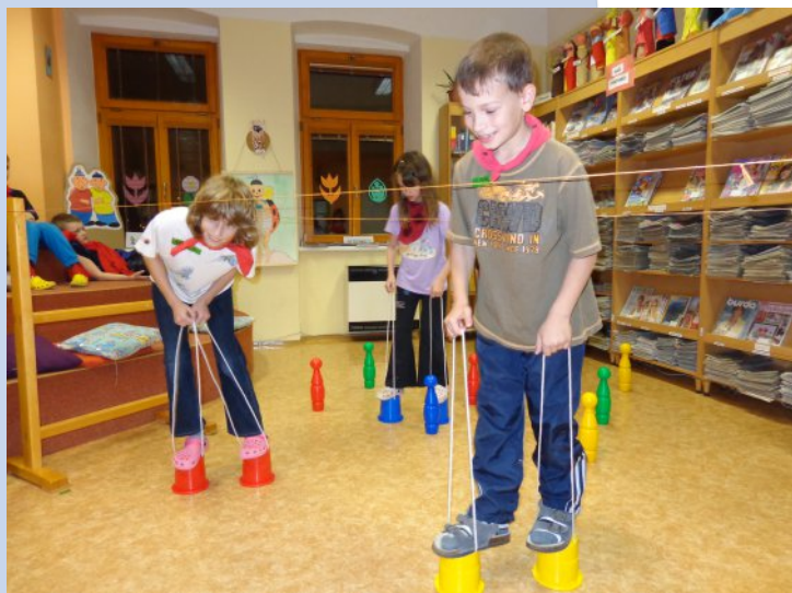
Noc s Andersenem - to je spousta her, soutěží a legrace!

Kluci a holky, láká vás tato akce? Tak neváhejte a přihlaste se, ale pozor! Počet míst je omezen, takže nejvyšší šanci mají ti, kteří se přihlásí co nejdříve! Uvidíte, že to bude noc plná zábavy a dobrodružství!