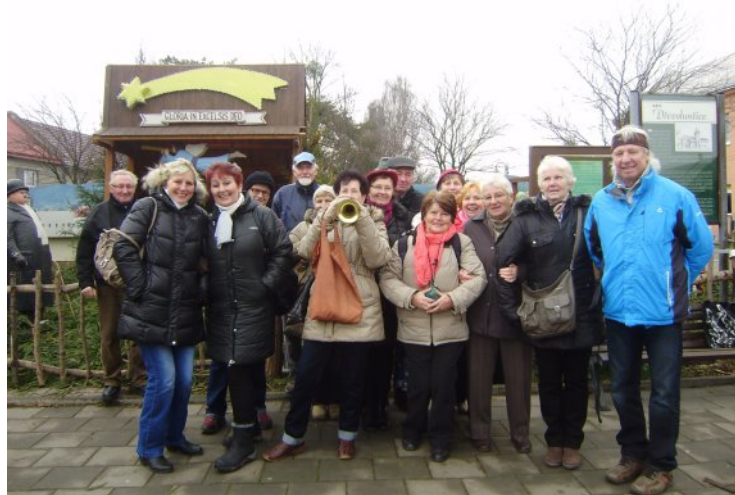
Studenti VU3V p ed d evohostickým betlémem